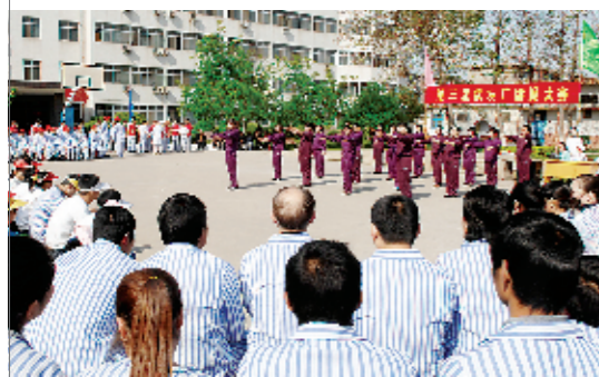
病友广播体操比赛