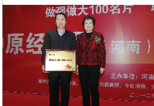
该院已成为中原经济区“百张名片”之一