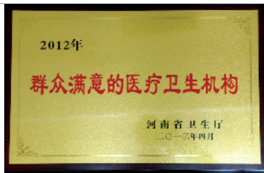
群众满意的医疗卫生机构