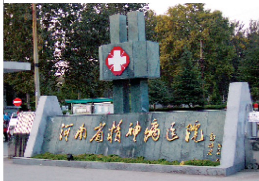
郭沫若题写的院名