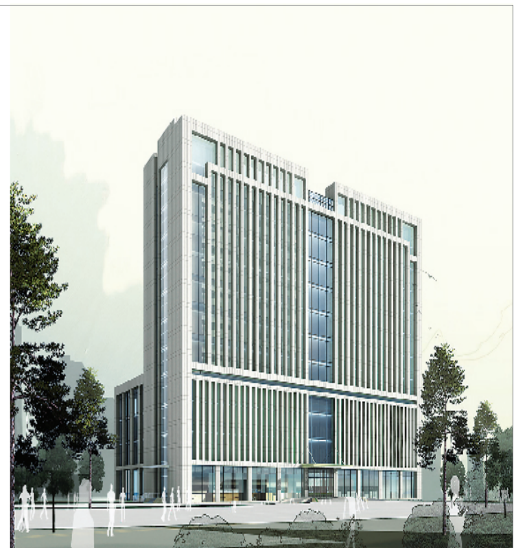
在建的综合病房楼效果图