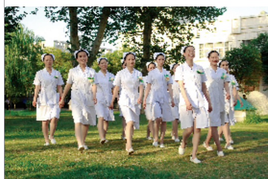
富有朝气的护理人员