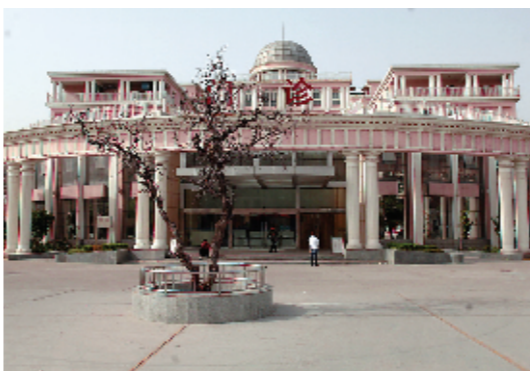
欧式风格的门诊楼